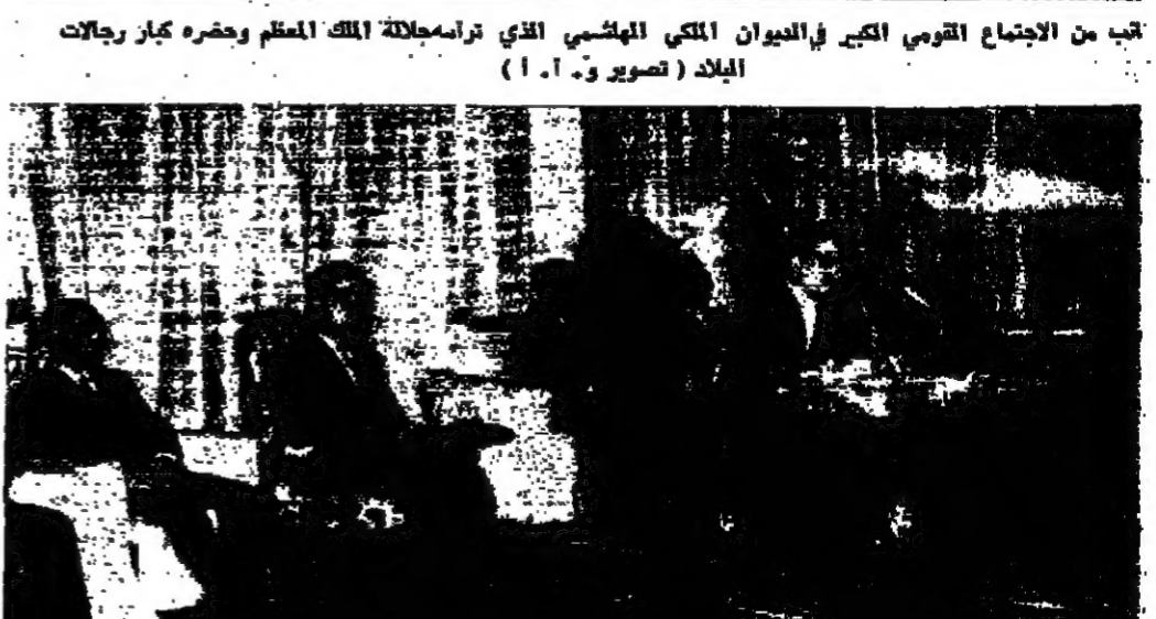
جلالة الملك المعظم يتحدث في الاجتماع ويصف جلالة سمو ولي العهد المعظم ورئيس الوزراء وسيداع رئيس الديوان الملكي وكبار رجال الديوان

حدث الحسين وقد استعرض جلالة الملك في هذا الاجتماع الوضع العام من جبهته جوانبه ، وأوضح دور كل مواطن من أبناء الأسرة الأردنية في المعركة . كما شرح جلالة بوقف الجيش العربي الأردني باعتباره درع الأمة وحصنها القوي ، وأشاد بجلاله بصمود جيشنا واستبساله في صموده في وجه العدوان الإسرائيلي